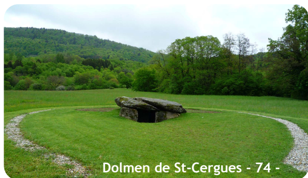
Dolmen de St-Cergues - 74 -

Inscription Geeb Chef-Lieu 74210 St-Ferréol